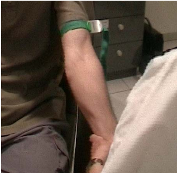
Mise en place du garrot avant la ponction veineuse