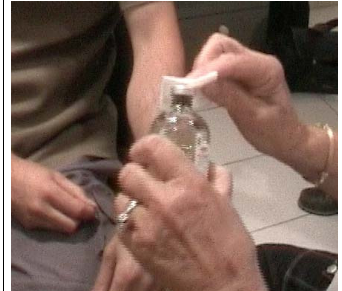
Désinfecter le bouchon du flacon d'hémoculture