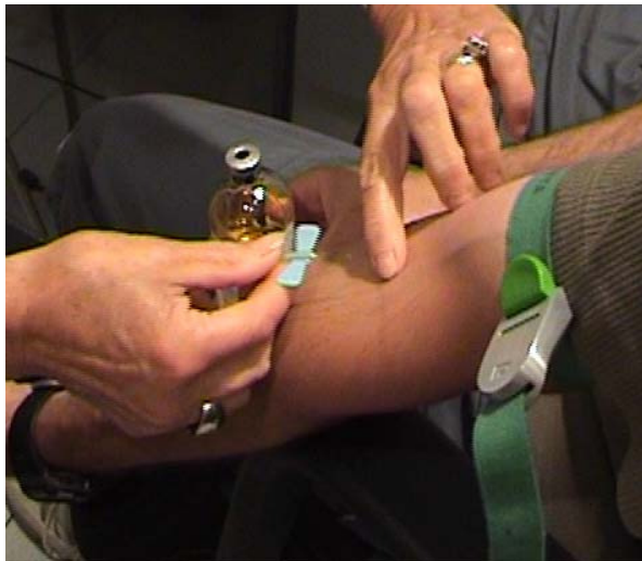
Ponction veineuse à l'aide d'une aiguille de type épicroannienne