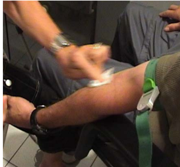
Nettoyer la zone de prélèvement avec un antiseptique