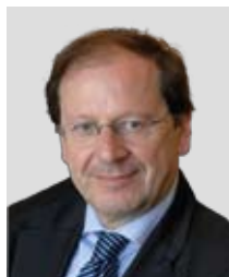
Hervé Novelli, secrétaire d'État chargé du Commerce, de l'Artisanat, des Petites et Moyennes Entreprises, du Tourisme, des Services et de la Consommation

Nous tous, consommateurs, avons pris conscience que nous pouvions, grâce à nos choix et à nos modes de consommation, agir au quotidien pour protéger l'environnement. Dans tous les secteurs, l'offre de produits « écologiques » se multiplie et se diversifie. L'environnement est désormais au centre des préoccupations et des stratégies des entreprises.