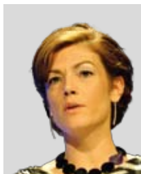
Chantal Jouanno, secrétaire d'État chargée de l'Écologie